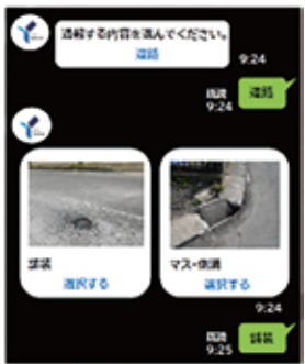
通報システム画面(イメージ)

市民の皆様が、スマートフォンから簡単な操作で、道路の破損をいつでも通報できるようにします。LINEの横浜市公式アカウントから、舗装の穴やカーブミラーの不具合等を選択式で入力、写真や地図も添付でき簡易に通報できるものです。一昨年から提案していたのですが、この4月中に利用が開始されます。